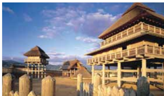
吉野ヶ里歴史公園

日本中の注目を集めた吉野ヶ里遺跡は、弥生時代の日本最大級の環壕集落跡です。貴重な文化遺産を保存し活用しようと、国と県の共同事業で、総面積117haの「吉野ヶ里歴史公園」として整備されています。